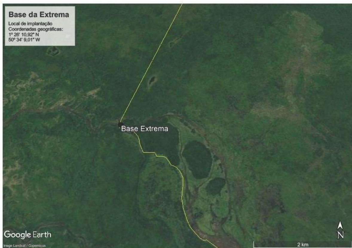
Figura 4. Localização da implantação da Base do Lago Comprido de Cima (Extrema)

Os projetos de arquitetura e complementares para Bases de Campo do igarapé do Tabaco (Base Tabaco) e do Lago Comprido de Cima (Base Extrema) foram contratados em 2014. No entanto, em razão de questões relacionadas a diferenças entre as áreas estimadas e as necessidades da unidade de conservação avaliadas ao longo do trabalho de elaboração dos projetos, decidiu-se por interromper a consultoria e realizar nova contratação com as áreas de fato necessárias. Na contratação anterior foram detalhados os projetos executivos arquitetônicos, os quais devem ser utilizados pelo consultor a fim de que sejam revisados e finalizados conforme estabelecido no presente termo de referência. A proposta é revisar os anteprojetos arquitetônicos existentes, mas manter o desenho já elaborado. Algumas áreas podem ser revistas, mas de acordo com o programa de necessidades (item 4). Todos os produtos já elaborados serão fornecidos, a saber: relatório da vistoria de campo (Anexo 1); anteprojetos arquitetônicos (Anexos 2 e 3) e memorial descritivo dos anteprojetos arquitetônicos (Anexo 4) por meio do link: