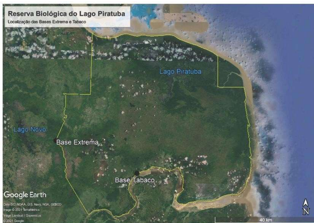
Figura 2. Localização da implantação das Bases do Igarapé do Tabaco e do Lago Comprido de Cima (Extrema) na Reserva Biológica do Lago Piratuba