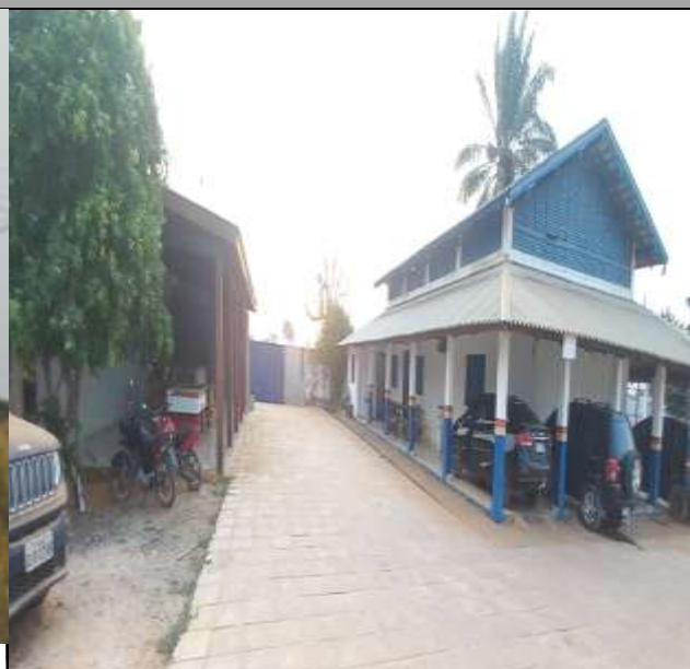
Fundos do Imóvel