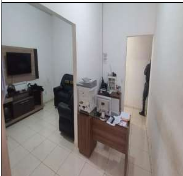
Imagem Interna da edificação