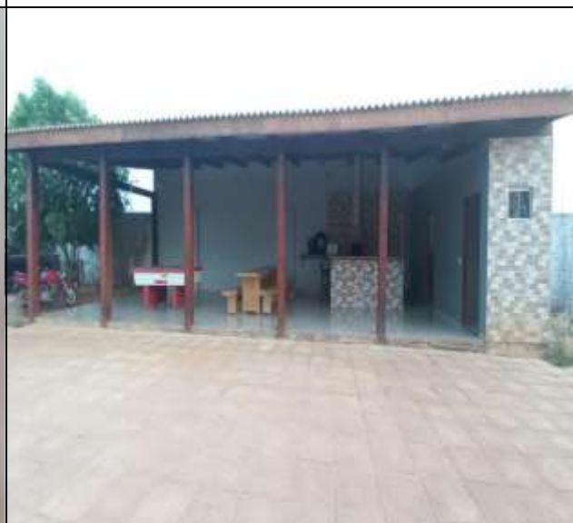
Imagem Interna edificação