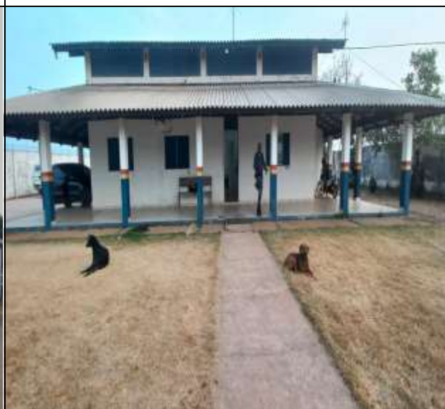
Imagem do Terreno