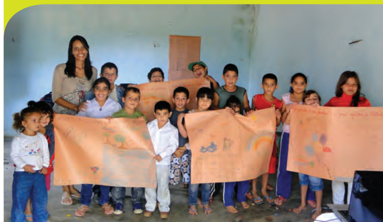
Cartazes produzidos pelas crianças da escola do Assentamento Zé Marcolino durante a atividade recreativa.

um recebeu uma cartolina para que os alunos desenhassem o que tinham aprendido durante a aula. Os desenhos feitos pelos alunos foram muito criativos, e traduziram a importância da biodiversidade local, mostrando as funções das plantas e dos animais na natureza. Esta atividade foi importante porque os alunos puderam trocar informações com os colegas, cada um ajudando o outro a aumentar o seu conhecimento sobre o assunto.