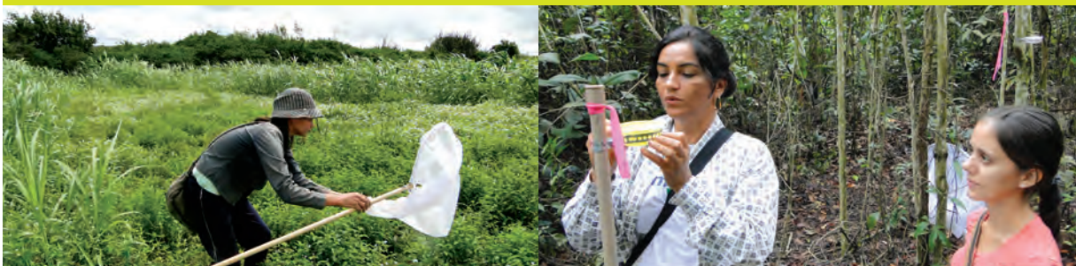
Coleta de abelhas com puçá em Remígio - PB (foto à esquerda) e pratos coloridos instalados em vegetação natural de floresta em Sinop - MT (foto à direita).