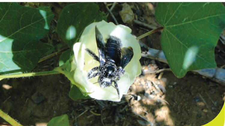
Abelha mamangava ( Xylocopa sp. ), uma das espécies polinizadoras do algodoeiro.