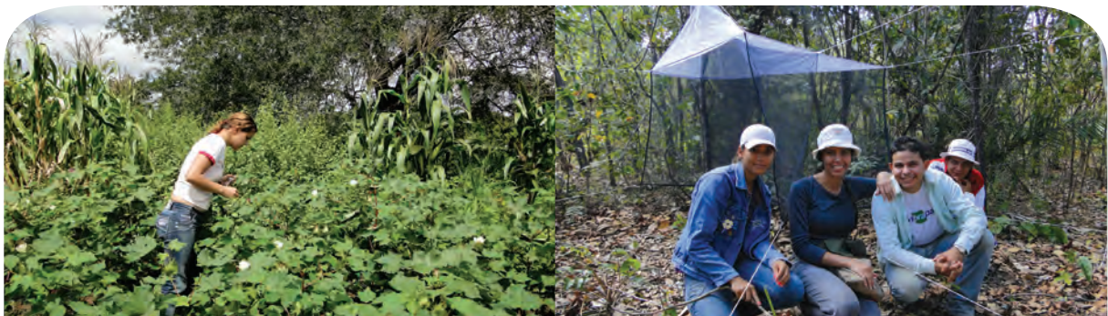
Coleta de abelhas nos algodoeiros em Prata - PB (foto à esquerda) e armadilha Malaise instalada em vegetação natural de cerrado em Mundo Novo - GO (foto à direita).

Ainda não sabemos se estamos perdendo polinizadores nas áreas que estudamos, mas com esses estudos, passamos a conhecer muitas espécies de abelhas que ainda não tinham sido registradas para esses locais. Agora que conhecemos as espécies vai ficar mais fácil conservá-las.