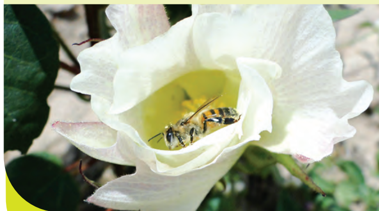
Abelha de mel ( Apis mellifera ), visitante floral muito frequente nos algodoeiros.